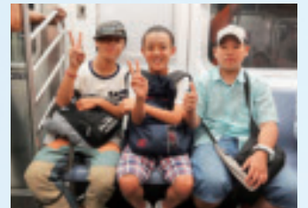
左上/タワーに挑戦！ 右下/ニューヨーク市内を地下鉄で移動(中央)