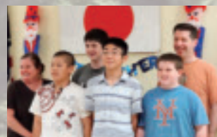
右上/水上スキーを体験 左下/ホストファミリーと(中央)