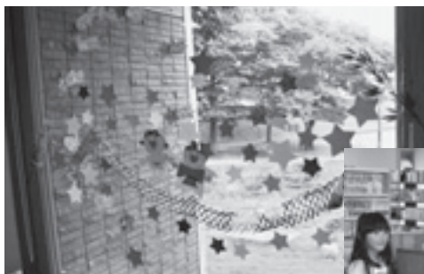
上／飾りつけをした館内 右／たなばたおたのしみ会に参加した皆さん

7月6日Ⓧに「たなばたおたのしみ会」を行いました。窓ガラスに星型の紙を貼って「天の川」を作ったり、願いを込めた短冊を飾ったりして過ごしました。