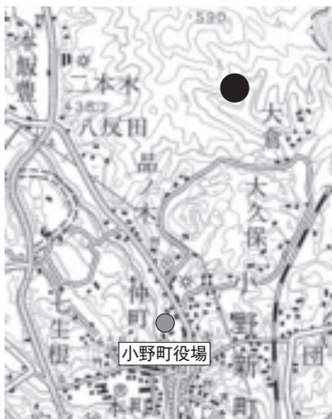
●仮置き場設置予定地（小野新町愛宕地内）