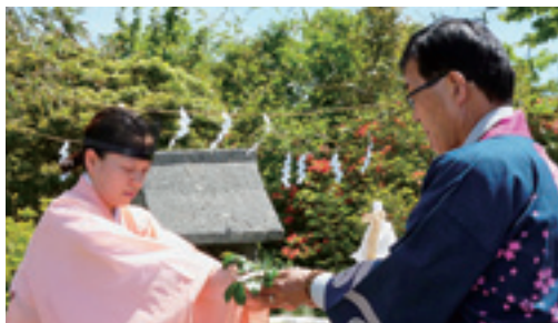
玉串奉典する町長(右)