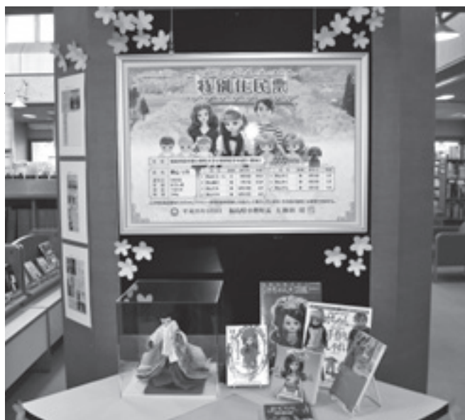
ふるさと文化の館(図書館内)