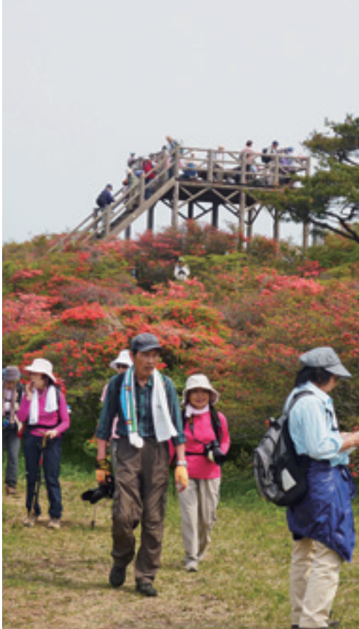
ツツジを楽しむ登山者