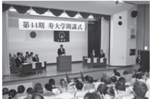
開講式の様子(学長式辞)

寿大学は、随時入学を受け付けておりますので、ご希望の方は公民館までご連絡ください。