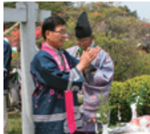
玉串奉典する町長(中央)