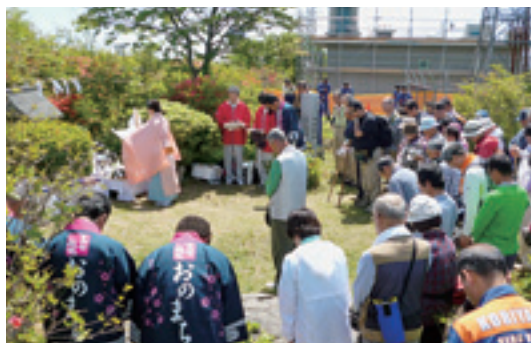
祈願祭に参加する皆さん