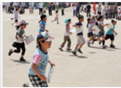
中央さくら保育園・小野わかば幼稚園