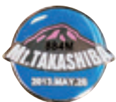
高柴山登山記念バッジ