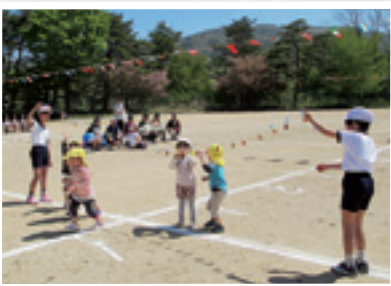
浮金つつじ児童園