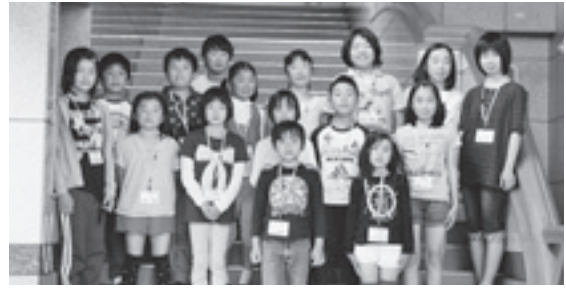
こども図書館講座参加者の皆さん

「第一回こども図書館講座」が5月25日㊦、ふるさと文化の館で行われました。第一回目の今回は図書館の仕事体験(初級編)として小学生16人が参加しました。子どもたちは『こども図書館員』として普段は入れない書庫を見学したり、本の貸出・返却などを行いました。皆さん終始熱心な様子で、さまざまな図書館の仕事を体験していました。