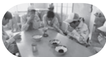
タンポポコーヒー試飲

温室には、鉢物の草花やハイビスカスが、動物舎では最近卵からかえったウコッケイのひなたちやウサギなどが増え、いっそうにぎやかになっています。