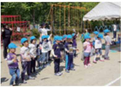
夏井おおすぎ保育園

各幼児施設の子どもたちも元氣いっぱいに参加しました。年長児のかけっこでは、一足早く1年生になった気分で元気に駆け抜けました。親子ダンスでは小さな子どもたちが楽しく踊る様子が校庭中が笑顔に包まれました。 地域の皆さんに見守られながら子どもたちも素敵な1日を過ごすことができました。