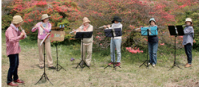
有志でフルートを演奏する皆さん