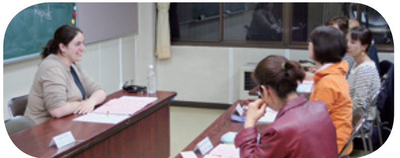
英会話教室の様子