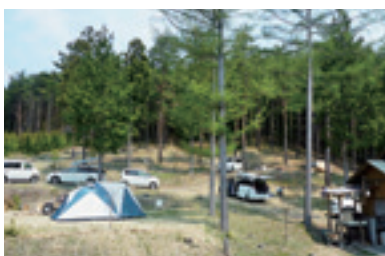
キャンプ場の様子