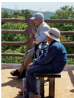
展望台で景色を楽しむ登山者