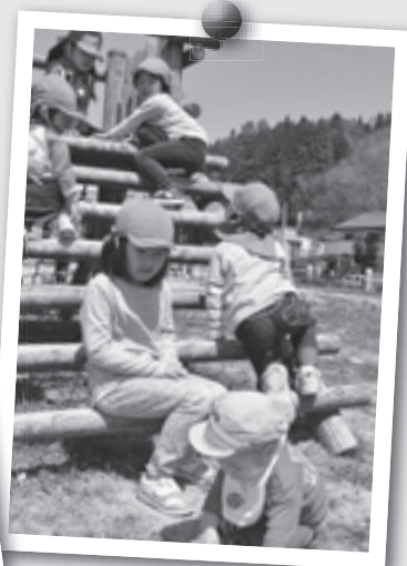
お外遊び、気持ちいいね

これまで、4月には園庭の桜でお花見をしながらおやつを食べたり、5月には子どもの日をお祝いしたり、こいのぼりを描いたりしてきました。これからも季節ごとの行事や遊びを通しての体験を大切に、子どもたちが楽しい園生活を送れるようにしたいと思います。