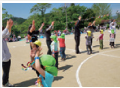
飯豊ひまわり保育園