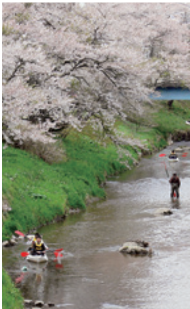
カヌーによる川下り