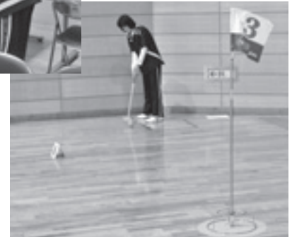
ニュースポーツ(グラウンドゴルフ)