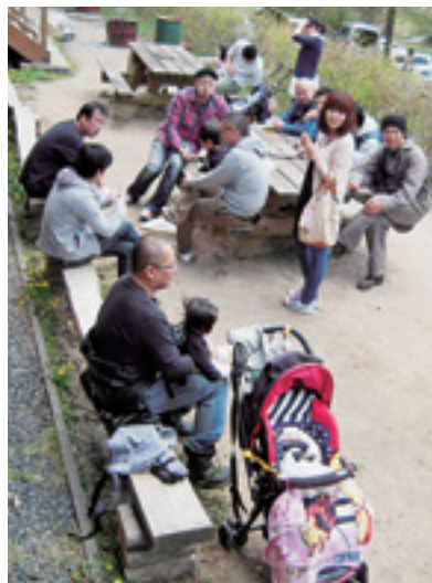
イベントを楽しむ皆さん