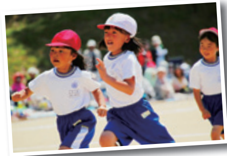
小学1・2年生かけっこ

「ゴールを目指し勝利を勝ち取れ!燃えろピクトリー」をスローガンに掲げ、全校児童379人で取り組みました。 1年生によるかけっこでは、今まで練習した成果を出し切ろうと、一生懸命に校庭を走り、勝利を目指して頑張りました。会場からはたくさん声援が上がりました。