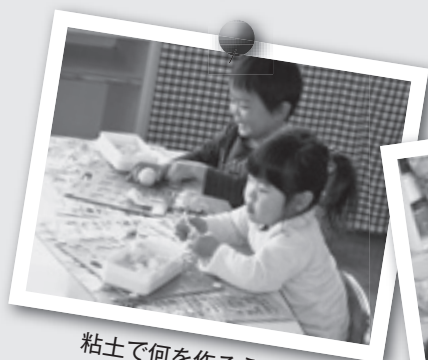
粘土で何を作ろうかな