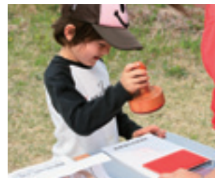
記念スタンプで思い出作り