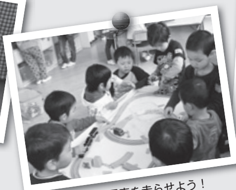
みんなで電車を走らせよう!