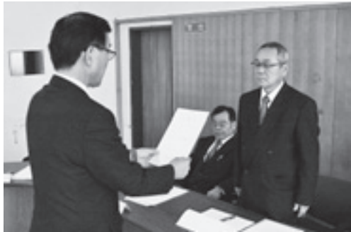
委嘱状交付の様子