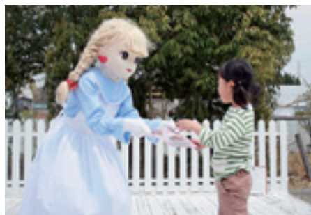
特別住民票のレプリカを渡すリカちゃん

リカちゃんキャッスルの名誉館長である大和田町長から、特別住民票が交付されました。 当日はたくさんの方が来場し、リニューアルされた館内を回り楽しんでいました。 なお今回交付した特別住民票はリカちゃんキャッスルおよび町に展示されています。特別住民票のレプリカは、来年の4月30日まで、町のウェブサイトでからダウンロードできますのでご覧ください。