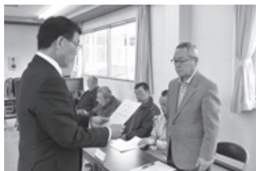
委嘱状交付の様子