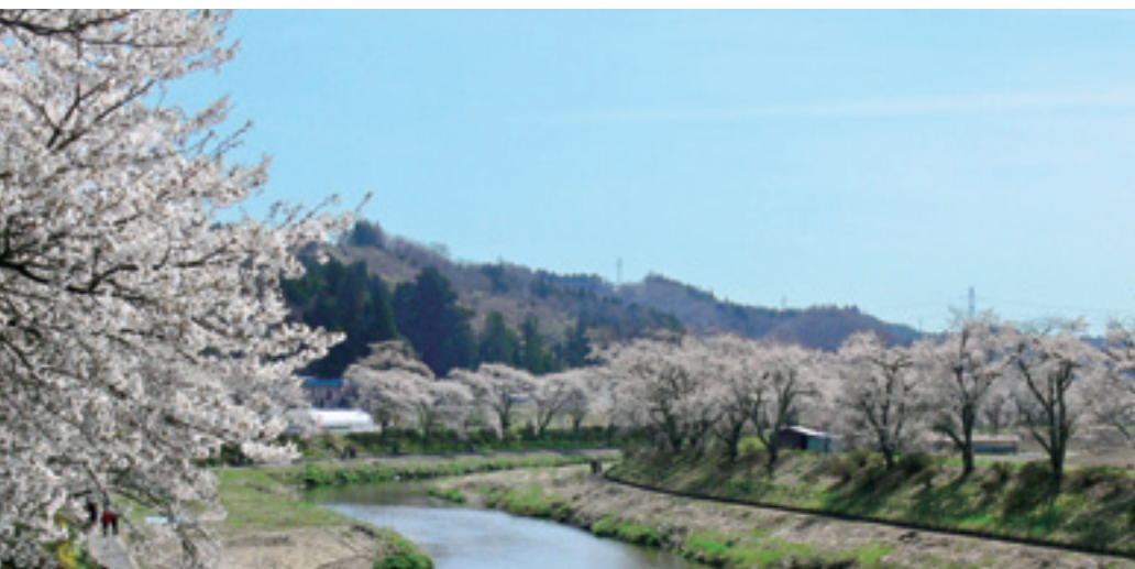
夏井千本桜(夏井・南田原井)

町内の桜が4月中旬、見ごろを迎えました。美しい桜が各地で咲き誇り、さまざまな方々が楽しんでいました。