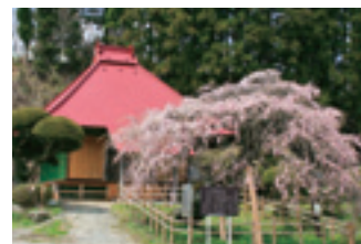
無量寺のしだれ桜(小野赤沼)