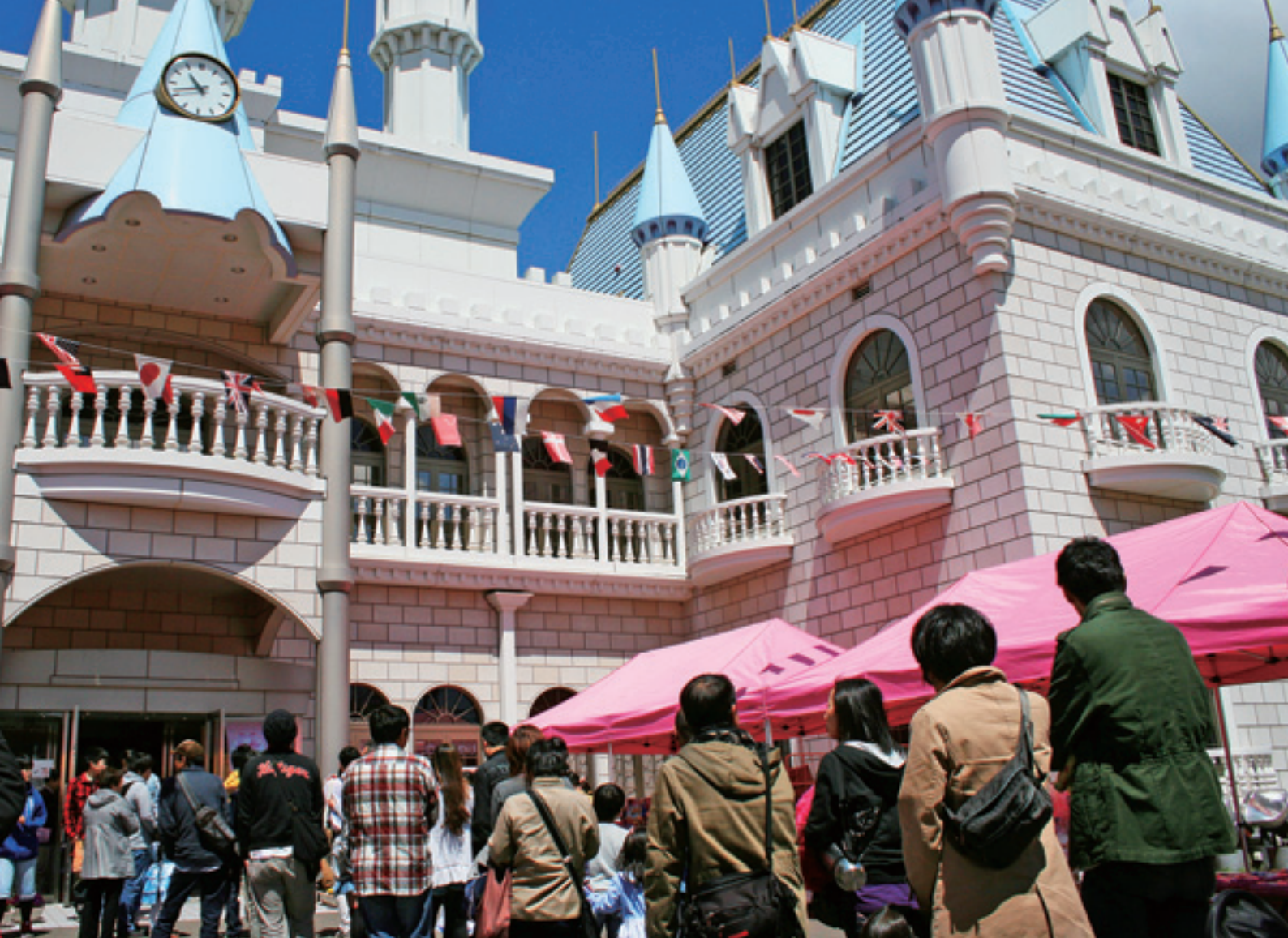
リカちゃんキャッスルに来場する皆さん