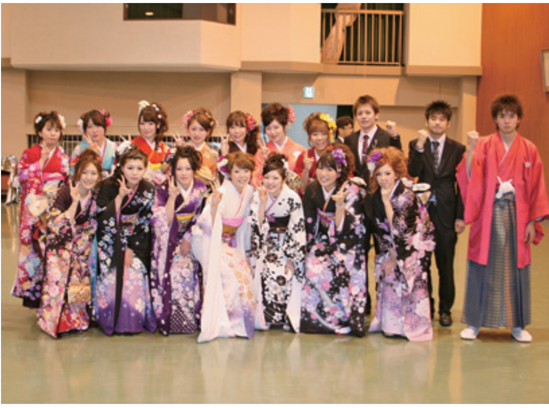
Coming Of Age Ceremony 2013