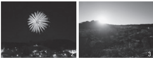
1_イベントに参加した皆さん／2_新しい年の幕開けを告げる花火／3_小野城址から望む初日の出