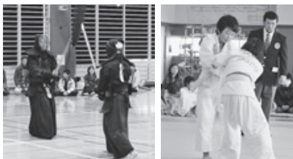
日頃鍛えた技と力を競い合う選手たち