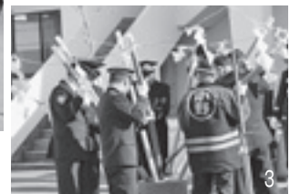
1, 2_出初式の様子／3_火伏の餅つき／4_無火災分団表彰