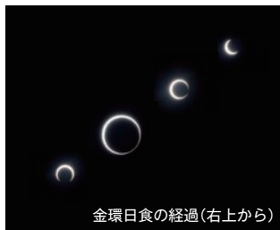
金環日食の経過(右上から)

あとがき 皆さんもご覧になったでしょうか、奇跡の天体ショー「金環日食」。普段はじっと見ることもない太陽に、多くの人々が注目したことと思います。21世紀で最後となる「金星の太陽面通過」は、あいにくの天気で見ることができませんでしたが、7月15日の昼には「木星食」、8月14日の未明には「金星食」が見られるとのこと。天体ショーの当たり年と言われている2012年、まだまだ空から目が離せそうにないですね。