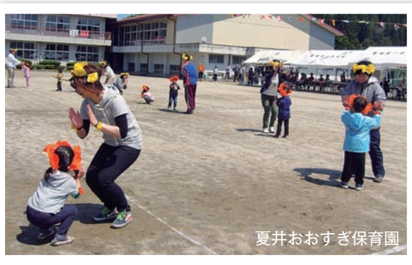
夏井おおすぎ保育園

生!」とこの日を心待ちにしていた気持ちだが、応援の皆さんにも伝わる元気な走りでした。続く3・4歳児の宝ひろいでは、4月に入園したばかりで泣いていた園児も「よいドン」の合図に大張り切りで、拾った宝物を得意気におうちの人に見せていました。 おうちの人と踊るのを楽しみにしていた親子ダンスの「ドコノキノコ」では、おそろいの飾りに親子の笑顔が花を添えました。