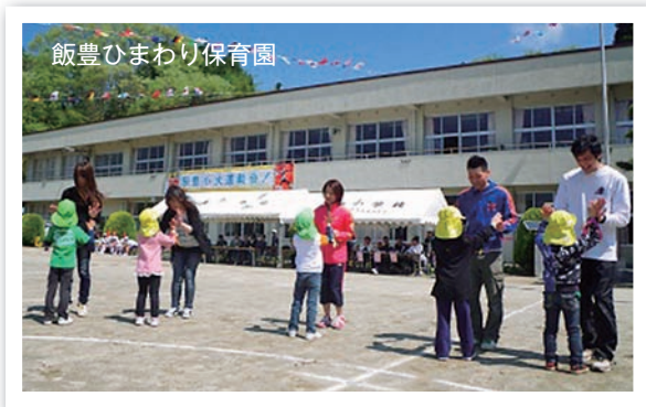
飯豊ひまわり保育園

生!」とこの日を心待ちにしていた気持ちだが、応援の皆さんにも伝わる元気な走りでした。続く3・4歳児の宝ひろいでは、4月に入園したばかりで泣いていた園児も「よいドン」の合図に大張り切りで、拾った宝物を得意気におうちの人に見せていました。 おうちの人と踊るのを楽しみにしていた親子ダンスの「ドコノキノコ」では、おそろいの飾りに親子の笑顔が花を添えました。