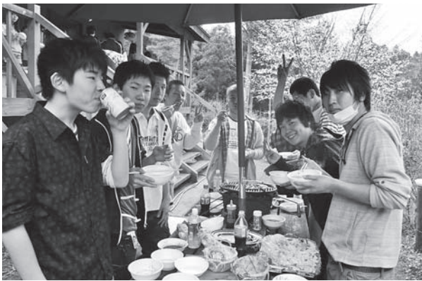
バーベキューを楽しむ双葉翔陽高の生徒