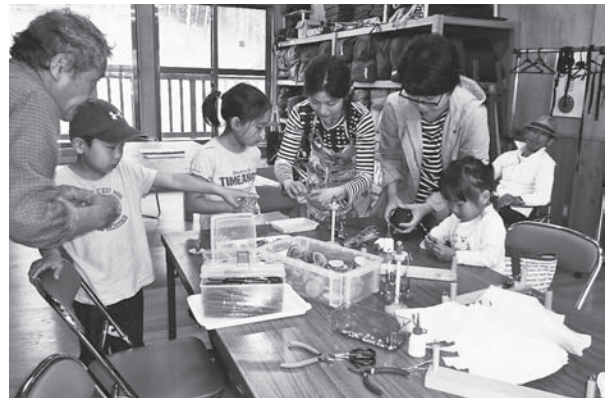
オープニングイベントで木工クラフトを楽しむ親子

双葉翔陽高校の生徒や教師約140人が5月2日、緑とのふれあいの森公園を訪れ、バーベキューを楽しみました。これは、昨年6月に双葉翔陽、富岡、相馬農業の3高校の野球部で構成された「相双連合」チームが同公園に招待されたことへのお礼と、学年の垣根を越えた全校生徒での交流を目的に、再度訪れたものです。