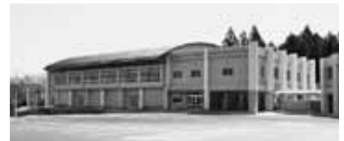
小野中学校屋内運動場

財産の状況 町は、行政執行のために必要な土地・建物・物品・債券などの財を所有していますが、その取得・管理および処分については、条例や規則に基づき適切な執行に努めています。 平成23年度下半期の財産の状況は、表4のとおりです。