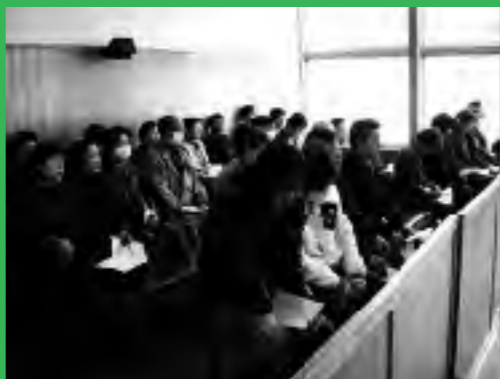
平成22年第1回定例会傍聴の様子

施設や療養施設として重要な施設でもあると思えます。さらに、老人福祉施設介護サービス事業所等との連携、協力による高齢者医療福祉の維持・充実は今後ますますニーズが広がってくると思えます。町民が安全・安心に暮らすための医療サービス機関として充実させていく必要があると思えます。