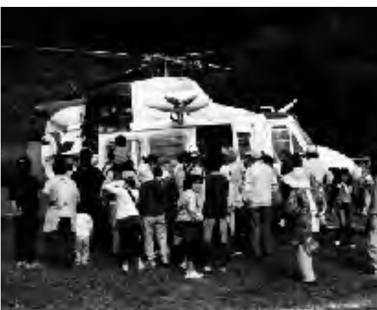
昨年の住民参加の防災訓練(皮籠石)

町長 現在は、消防団七分団持ち回りで毎年総合防災訓練を実施しています。全町民が参加できる総合防災訓練については、実施体制の整備、効果検証等も含めて検討していきたいと考えています。また、防災への啓発を推進し、現在の訓練が多く町民に浸透するように検討していきます。