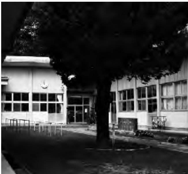
廃校となった小戸神小学校

活用は町民の合意形成が前提にあるが、インターネットを利用して売却する方法もある。考えは。