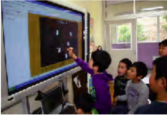
電子黒板での授業の様子(浮金小学校)

小野中学校の改築工事は、授業に支障のないように一部解体と建築を繰り返す方法により施行され、平成23年8月完成予定です。