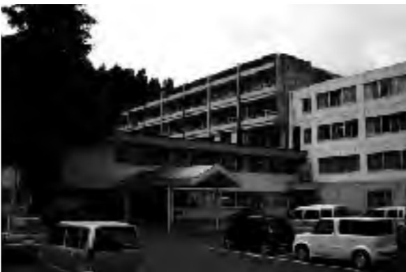
4月から、より企業的経営を求められる総合病院

町長 地方公営企業法の適用により、経営責任の明確化、自立性の拡大が図られ、効果的・効率的な運営体制が確立されます。また、独立した企業としての自覚が促されコスト意識や経営意識が高まるものと考えています。