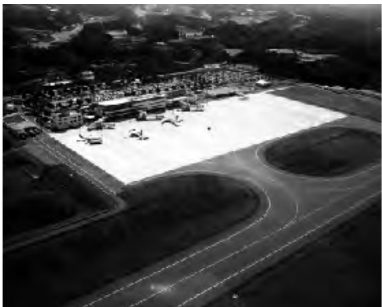
利用の拡大が望まれる福島空港

町長 町振興のため財政基盤の確立を図ったうえで元氣の出る企画を検討していきます。