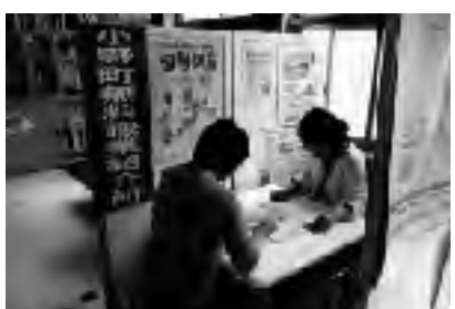
厳しい雇用情勢が続いている。