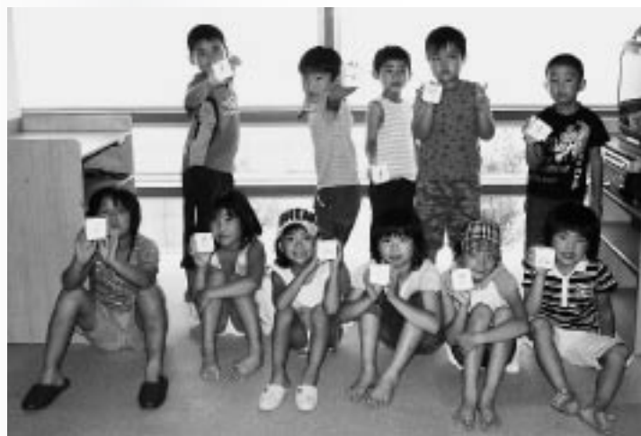
パズル完成したよ！

終わりに参加者全員で、作ったパズルと一緒に記念撮影。自分のパズルを手にした子どもたちの顔は、とてもうれしそうでした。