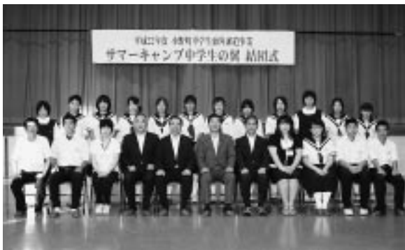
団員と引率者の皆さん

中学生の翼は、7月28日から8月6日までの10日間の日程で、アメリカ合衆国ニュージャージー州グリーンロック町でのホームステイと、ニューヨーク州ハンコック町でのキャンプ活動を行います。