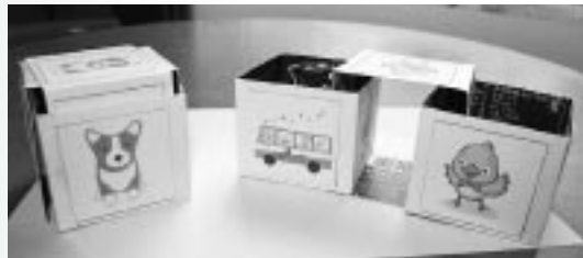
牛乳パックを使ったパズル

小学生を対象にした工作教室が7月24日に開催され、今回は牛乳パックを使ったサイコロ型のパズル作りに挑戦しました。