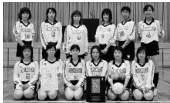
家庭バレーボール優勝 小野新町チーム