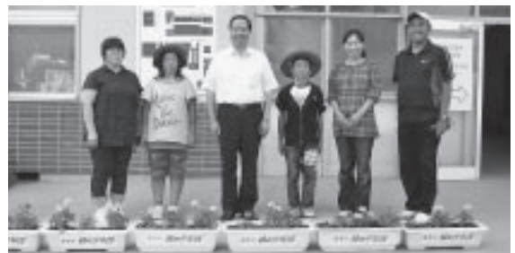
飯豊小学校緑の少年団の皆さん