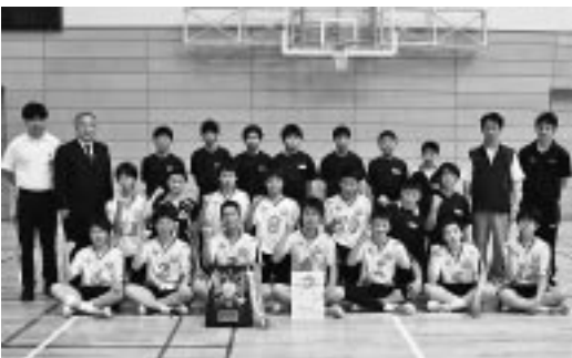
小野中男子バレー部の皆さん

東北大会前に町長室を訪れた選手の皆さんは、東北大会での抱負を述べ、町長から激励の言葉と激励金が贈られました。