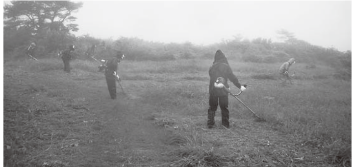
雨の中作業をする湯沢地区の皆さん

湯沢地区の有志の方々が6月21日、ボランティアで小野町の最高峰「矢大臣山」の山頂周辺の整備を実施しました。 平成13年から始まったこの活動は、地元のをきれいに整備し、訪れる登山客の皆さんに阿武隈高原の自然を楽しんでいただくという思いから、毎年行っているものです。 当日はあいにくの雨でしたが、参加された皆さんは一生懸命に作業に取り組んでいました。 紙上よりお礼申し上げます。