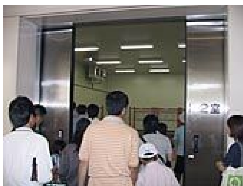
図 6-3 福島県主催の新エネルギー施設親子見学会の様子(2004年)