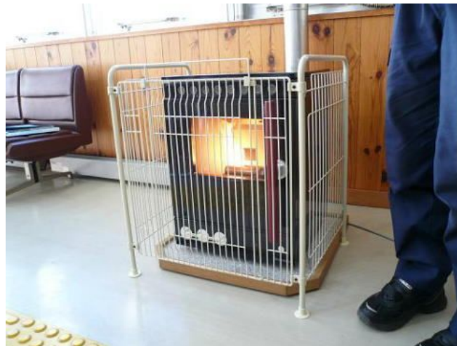
図 6-2 いわき東警察署(泉駅前交番)に設置されたペレットストーブ