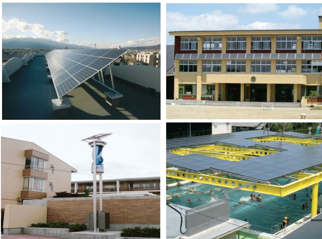
図 6-1 学校向け太陽光発電システム導入のイメージ