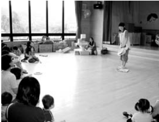
郡山女子短大の実習生による うちわ紙人形劇のようす

今後も、お母さん方と一緒に子育ての苦労を共感したり、子育ての喜びを伝えながら、子育ての楽しさを再確認する場を提供していきたいと思えます。ぜひ、ご利用ください。