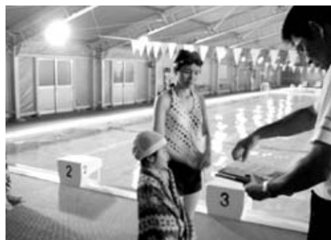
修了書を受け取る参加者のみなさん

7月31日～8月4日の5日間海洋センタープールにおいて町民・親子少年水泳教室を実施しました。教室には17名の方が参加し、町民の部、親子の部に分かれ水泳の基本を学びました。 最終日には成果発表を行い5日間の練習の成果を披露しました。 これから水泳に親しんでください。