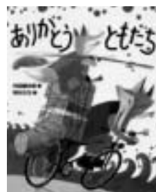
「ともだちや」シリーズより 「ありがとうともだち」 (降矢なな/絵内田麟太郎/作備成社)