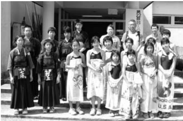
大会に参加した水泳スポーツ少年団、剣道スポーツ少年団の選手のみなさん

7月30日、柳津町B&G海洋センターにおいて、第22回B&Gスポーツ大会福島県大会が開催され、小野町からは水泳スポーツ少年団、剣道スポーツ少年団が出場しました。 県内にB&G施設のある市町のチームが参加し、水泳の部、剣道の部で熱戦が繰り広げられました。小野町チームは水泳総合の部、剣道の部でそれぞれ第3位になりました。