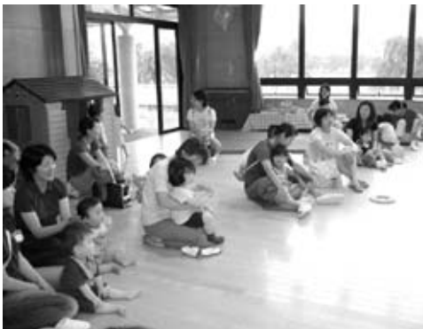
親子で紙人形劇観賞